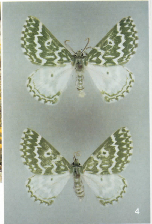
Fig. 1-4. Biología de Thetidia plusiaria : 1. Santolina chamaecyparissus (Compositae), planta nutricia de Thetidia plusiaria . 2. Oruga de Thetidia plusiaria , con hojas de la planta nutricia adheridas al cuerpo para facilitar la cripsis. 3. Capullo de Thetidia plusiaria . La oruga ha utilizado fundamentalmente las hojas que recubrían su cuerpo. 4. Imagos, macho y hembra, de Thetidia plusiaria .

algodonosa que recubre gran parte de los tallos de la planta. Asimismo, empieza a recubrir su cuerpo con hilos de seda y con algunos materiales muy ligeros (en la caja de cría se colocan algunas escamas de recubrimiento de la madre, lo que le confiere un aspecto verdoso). En los siguientes estadios larvarios, la oruga recubre su cuerpo con hojas de la planta nutricia, que sujeta a una serie de proyecciones en forma de pináculos muy desarrollados y con numerosos dientes. En estos, con la ayuda de hilos de seda, la oruga sujeta fácilmente las hojas y otros materiales de la planta a su cuerpo, lo que le confiere un camuflaje excepcional. Cada pináculo está dotado de una seta mecanoreceptora (sensilio tricódeo), que probablemente permite a la oruga localizar con exactitud el emplazamiento de la verruga, así como conocer cuando -por roces con la planta- ha perdido parte de su protección. Este tipo de comportamiento tan sólo ha sido señalado en los geométridos Synchlora (Ferguson, 1985), Comibaena y Thetidia (Herbulot, 1978); en el caso de este último género, con la especie Thetidia smaragdaria .